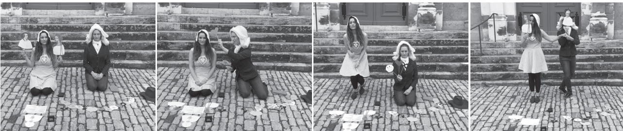
Inszenierung von Goethes Mailed am Herderplatz in Weimar