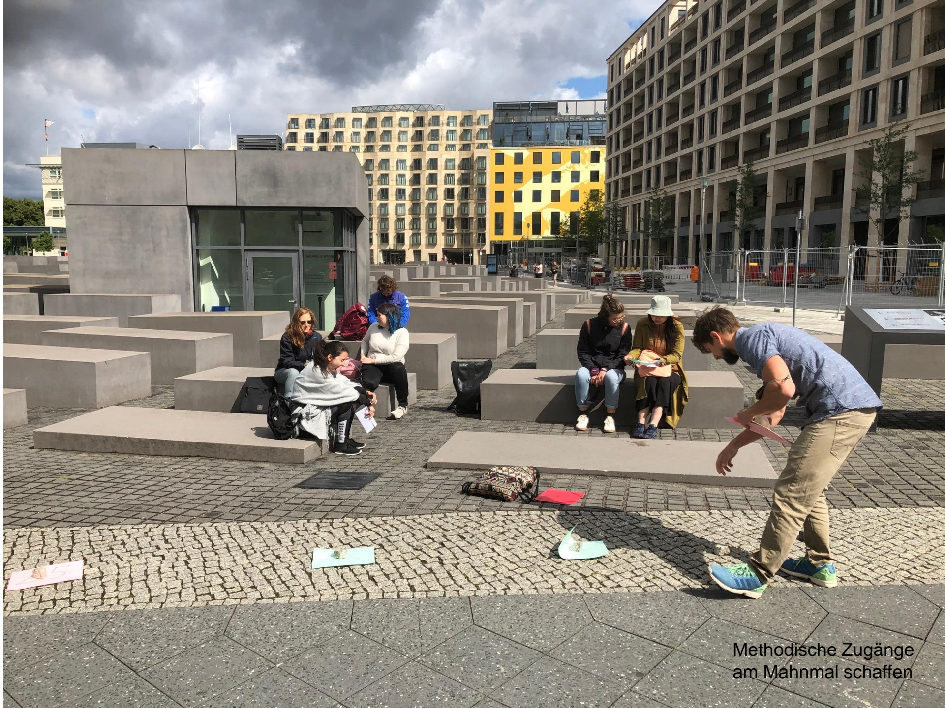
Methodische Zugänge am Mahnmal schaffen