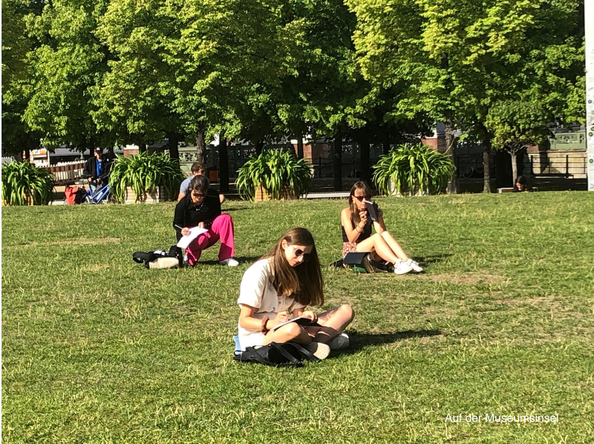
Auf der Museumsinsel