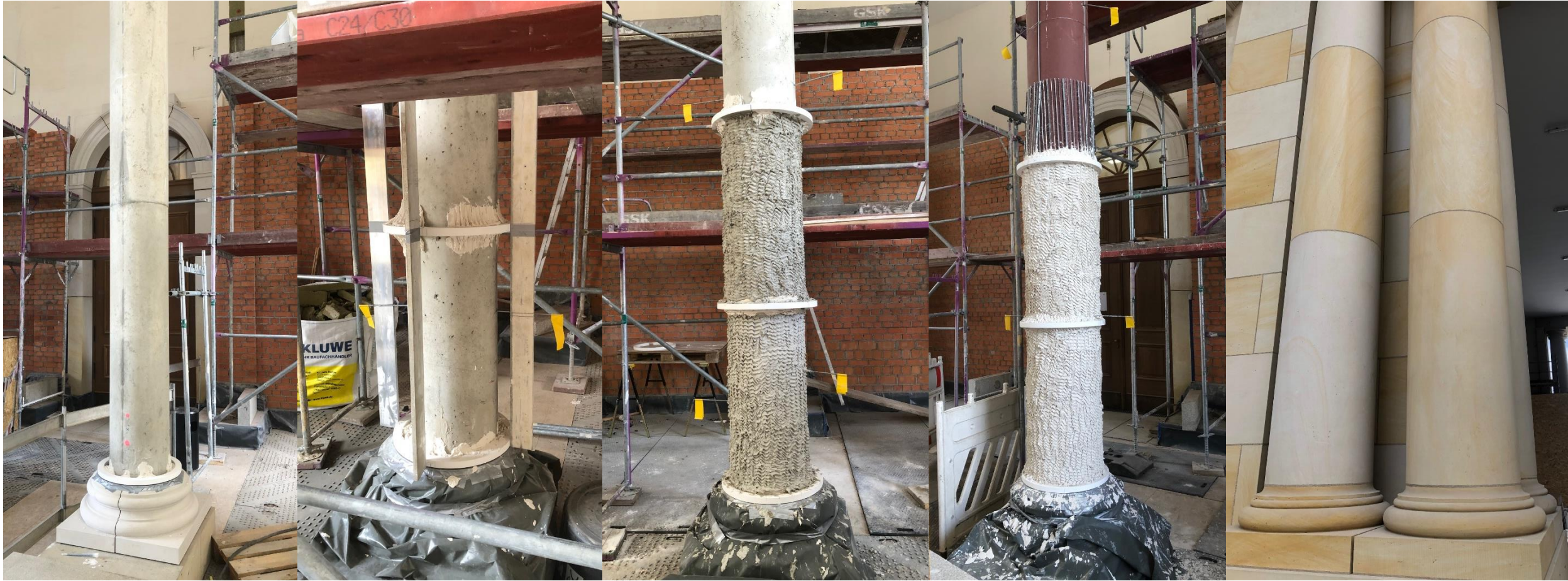
Berliner Schloss – mehr als nur Schein?