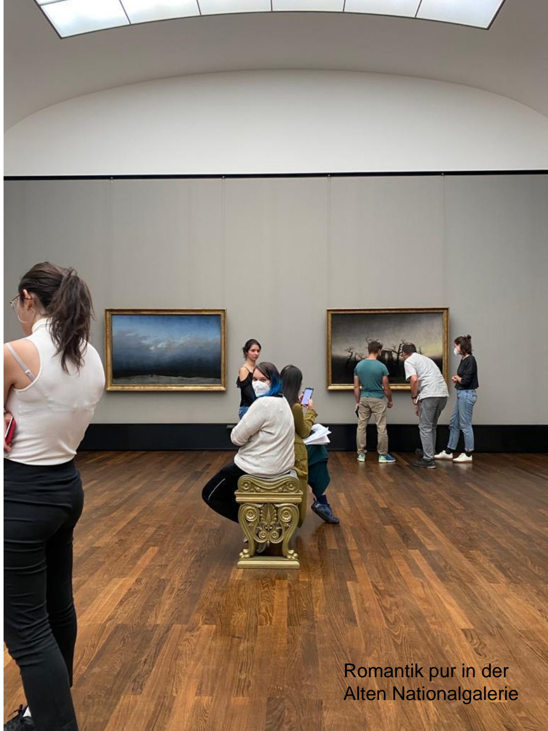
Romantik pur in der Alten Nationalgalerie