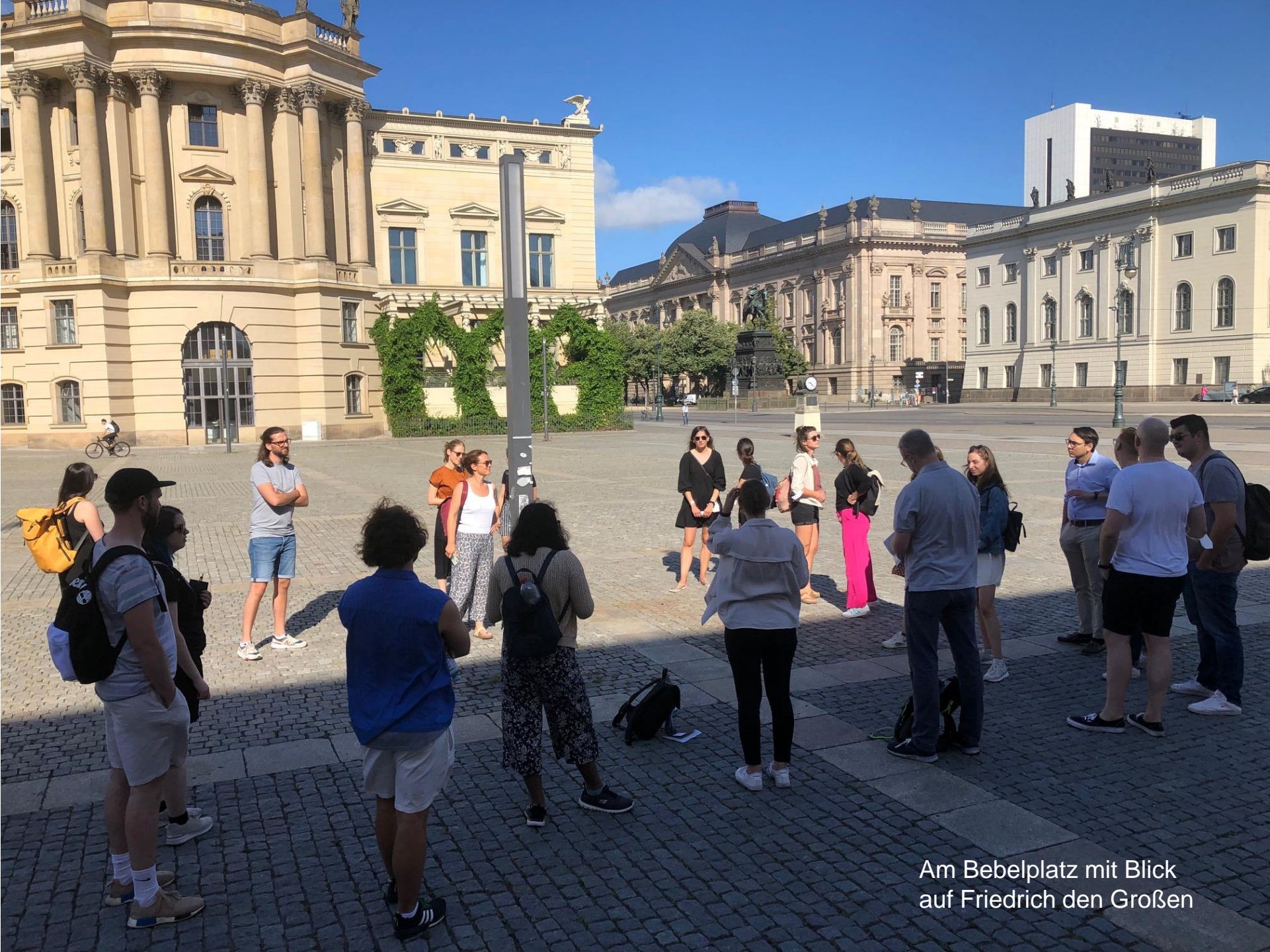
Am Bebelplatz mit Blick auf Friedrich den Großen