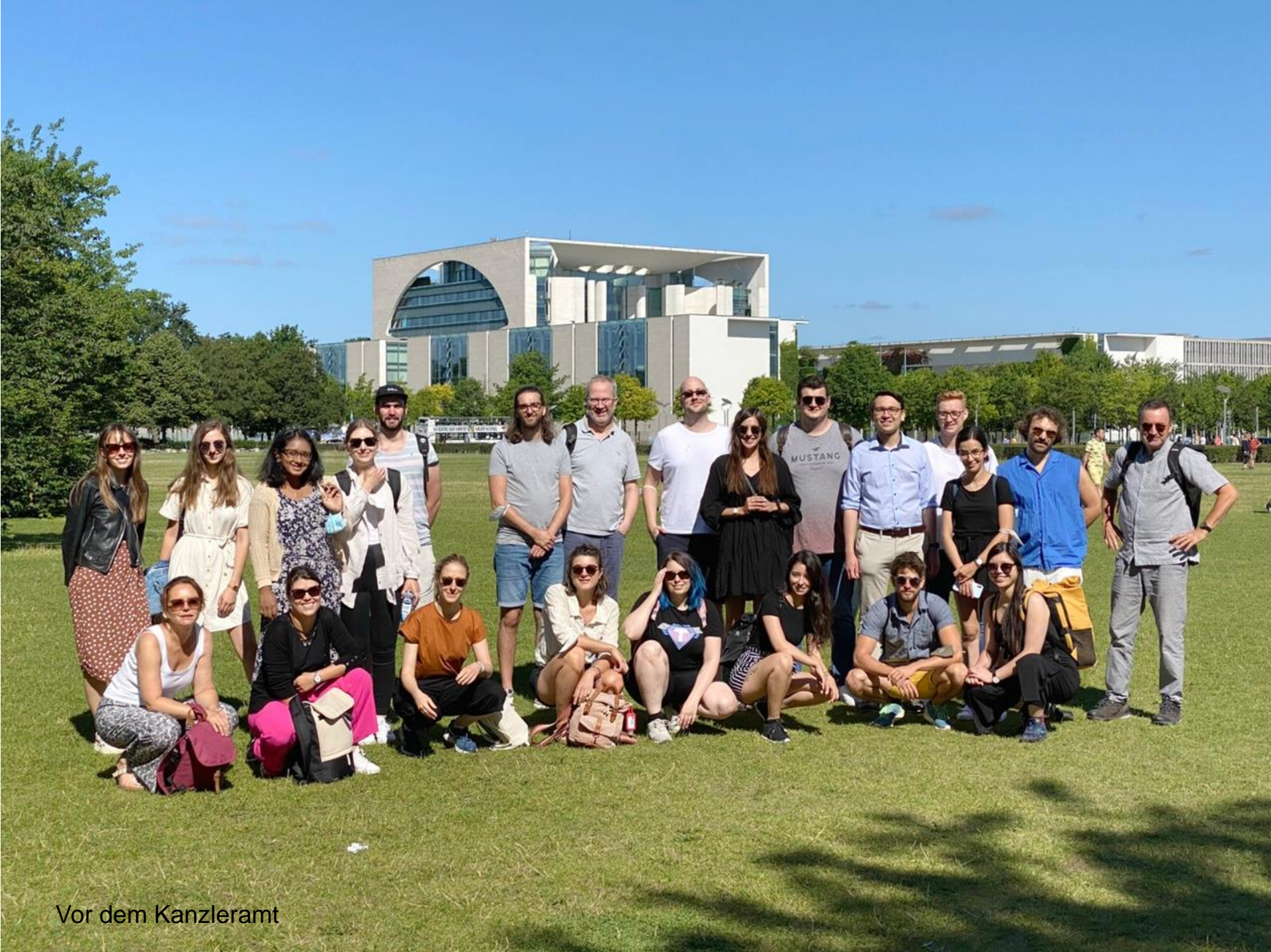
Vor dem Kanzleramt